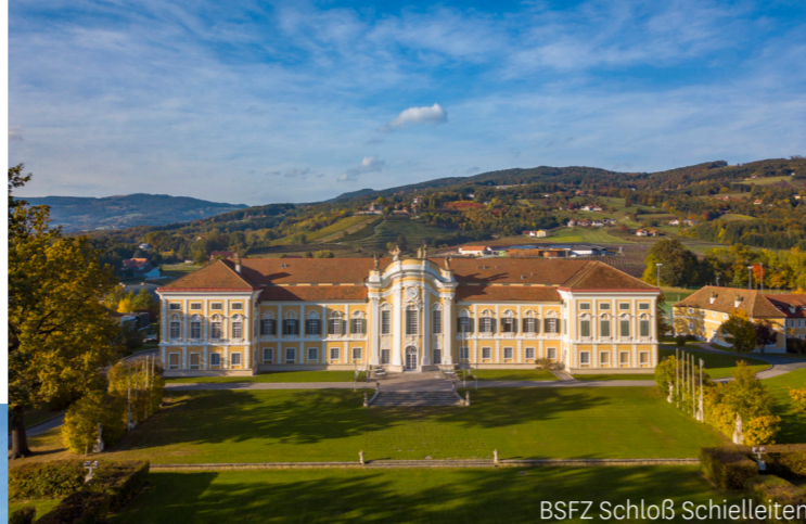
BSFZ Schloß Schielleiten