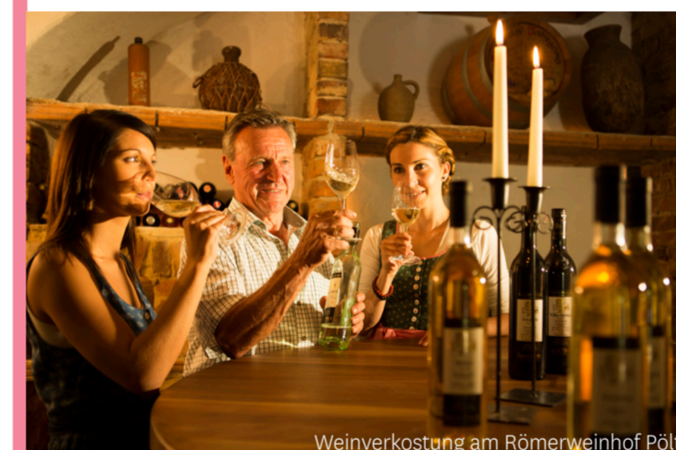
Weinverkostung am Römerweinhof Pörtl

Das Winzerfest in Hartberg , verbunden mit dem Erntedankfest, ist ein jährliches Highlight!