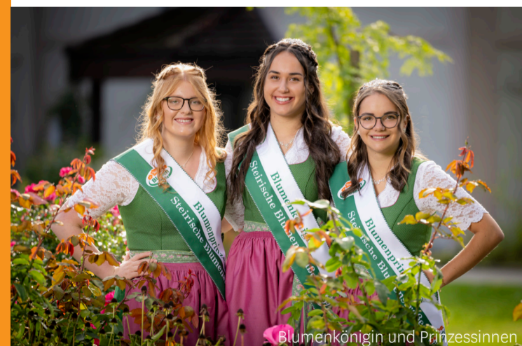
Blumenkönigin und Prinzessinnen

Im Jahr des Blumenkorsos findet auch immer die Wahl der neuen Hoheiten statt. Die Bewerberinnen aus der Region müssen ihre Regionskenntnisse, aber auch ihr Fachwissen im Bereich Blumen und Gärten unter Beweis stellen oder ihre Fähigkeiten beim Blumenstraß binden zeigen. Eine Jury wählt dann die neue Blumenkönigin und ihre beiden Prinzessinnen.