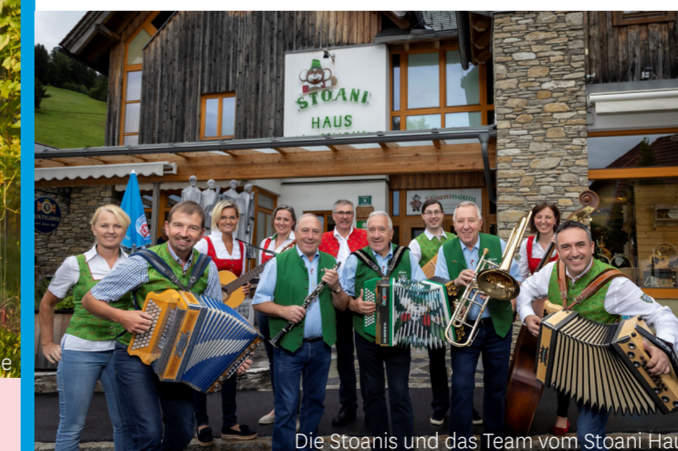
Die Stoanis und das Team vom Stoani Haus

Rockige, poppige Tanzmusik-Gruppen vereinen sich mit der traditionellen, steirischen Volksmusik, mit Hausmusikgruppen, Kirchenchören, (Streich-) Quartettgruppen und vielen mehr.