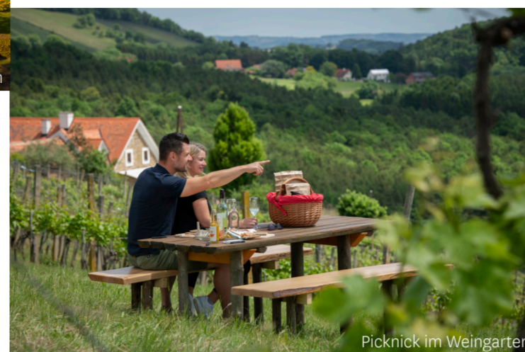
Picknick im Weingarten

Beginnend in Gleisdorf führt die Römerweinstraße durch das malerische oststeirische Hügelland über Stubenberg und den Naturpark Pöllauer Tal nach Hartberg und weiter bis nach Bad Waltersdorf. Nur auf den sonnigsten Hängen wurde der Wein angepflanzt, deshalb sind die Weingärten inselartig angeordnet.