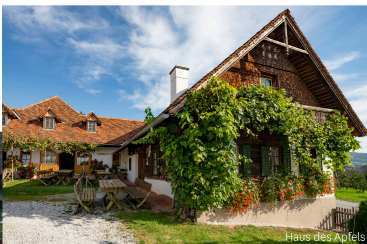
Haus des Apfels

Ab Mitte April verwandelt sich die Steirische Apfelstraße in ein duftendes Blütenmeer, wenn fünf Millionen Apfelbäume, die entlang der Apfelstraße die Hügel überziehen, in zartem Rosa und Weiß erblühen. 25 km lang windet sich die fruchtbare Straße durch den „Garten Österreichs“ und verbindet die Obstgärten mit Gasthöfen und Direktvermarktern.