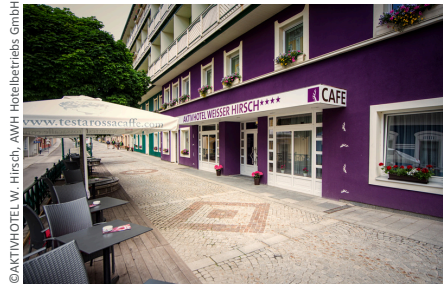
© AKTIVHOTEL W. Hirsch, AMH Hotelbetriebs GmbH