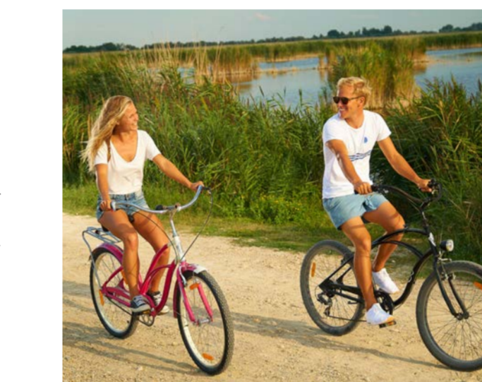
Entlang des Schilfgürtels am Neusiedler See

NEUSIEDLER SEE RADWEG. SONNE, STRAND UND SEE, VIELE EINZIGARTIGE GENUSSPUNKTE UND UNZÄHLIGE KULTURHIGHLIGHTS AM NEUSIEDLER SEE. HIER LÄSST ES SICH GENUSSVOLL IN DIE PEDALE TRETEN.