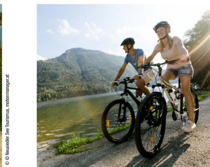
Ybbstalradweg in Lunz am See

YBBSTALRADWEG. FAMILIENFREUNDLICH, GENUSSREICH, BESONDERS SICHER UND ABWECHSLUNGSREICH: DER YBBSTALRADWEG. IN SEINEM HERZSTÜCK FOLGT ER EINER EHEMALIGEN BAHNTRASSE DURCH SCHLUCHTEN UND ÜBER BRÜCKEN BIS LUNZ AM SEE.