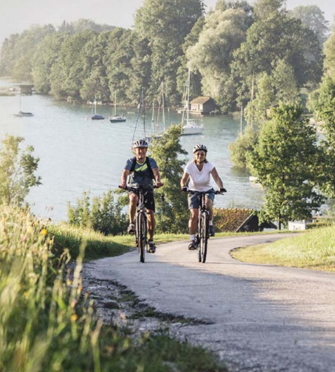
Radfahren am Attersee

AM NENNS: Klarstellend wird festgehalten, dass unter „...radweg“ bzw. „...radtour“ jener Weg zu verstehen ist, der Radfahrern entlang des angeführten Flusses bzw. durch die angegebene Region zur Verfügung steht. Es wird aber ausdrücklich darauf hingewiesen, dass Teile der Wege auch von anderen Verkehrsteilnehmern genutzt werden und zwar sowohl mit Kraftfahrzeugen als auch zu Fuß. Weder Radouren in Österreich noch die angeführten Partner, Wandertourismusorganisationen oder Verbände haften hinsichtlich der beschriebenen Wege, weder für eine bestimmte Beschaffenheit bzw. einen bestimmten Zustand derselben, noch für deren Befahrbarkeit. Die Benutzung sämtlicher Wege und Strecken erfolgt auf eigene Gefahr und in Eigenverantwortung; vor allem unter Berücksichtigung der jeweils vorherrschenden Witterungsbedingungen und -verhältnisse.