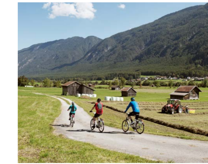
Unterwegs in Nassereith

VIA CLAUDIA AUGUSTA. ENTLANG DER RADROUTE VIA CLAUDIA AUGUSTA WIRD DER URALTE KULTUR- UND HANDELSWEG DES RÖMISCHEN REICHES ZWISCHEN DER DONAU UND DER ADRIA WIEDER LEBENDIG.