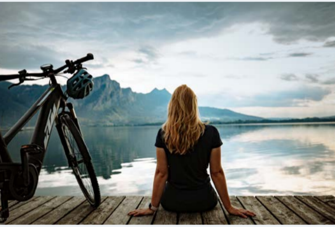
Am Mondsee in Loibichl

RADTOUREN IN ÖSTERREICH GF durch Steirische Tourismus und Standortmarketing GmbH - STG St-Peter-Hauptstraße 243 | 8042 Graz T +43 316 4003-0 info@radouren.at | www.radouren.at www.fb.com/Radouren.Osterreich #radoureninoesterreich