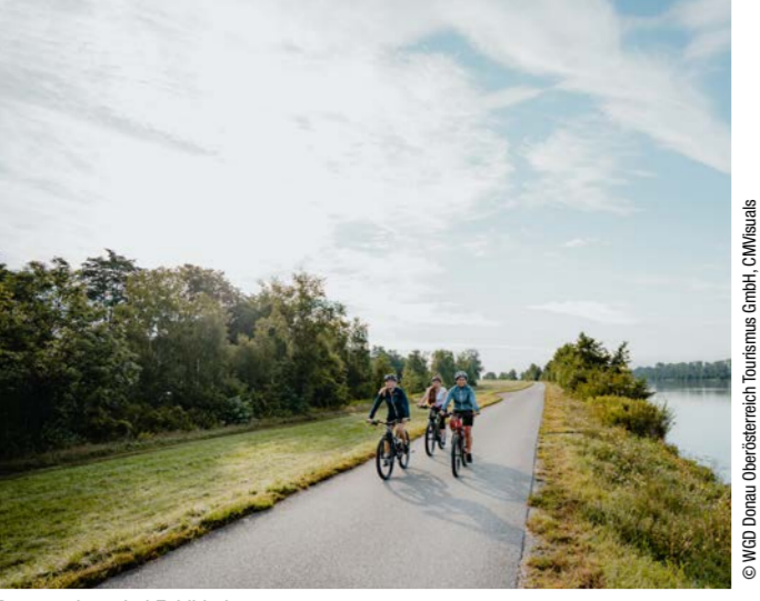
Donauradweg bei Feldkirchen

DONAU RADWEG. DER DONAU RADWEG ZÄHLT ZU DEN BELIEBTESTEN ROUTEN EUROPAS. DURCH DIE ABWECHSLUNGSREICHE MISCHUNG AUS LANDSCHAFT UND STÄDTEN STRAHLT ER EINE BESONDERE ANZIEHUNGSKRAFT AUS.