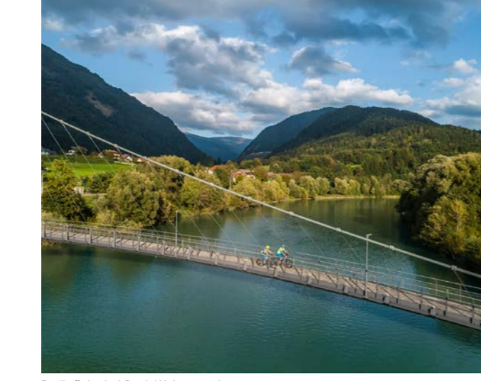
Radbrücke bei Puch Weissenstein

DRAU RADWEG. VON DEN DREI ZINNEN, WO DIE DRAU IN SÜDTIROL ENTSPIRGT, DURCH OSTIROL, KÄRNTEN, SLOWENIEN BIS NACH LEGRAD, WO SICH DRAU UND MUR VEREINEN. GENUSSRADELN SÜDLICH DER ALPEN.