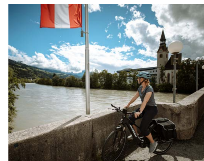
Auf der Steinbrücke in Schwaz

INN RADWEG. VON DEN GIPFELN DER ALPEN QUER DURCH TIROL INS HÜGELLAND BAYERNS BIS ZU DEN AULANDSCHAFTEN OBERÖSTERREICHS BIETET DER INN RADWEG EINE ABWECHSLUNGSREICHE REISE DURCH 3 LÄNDER.