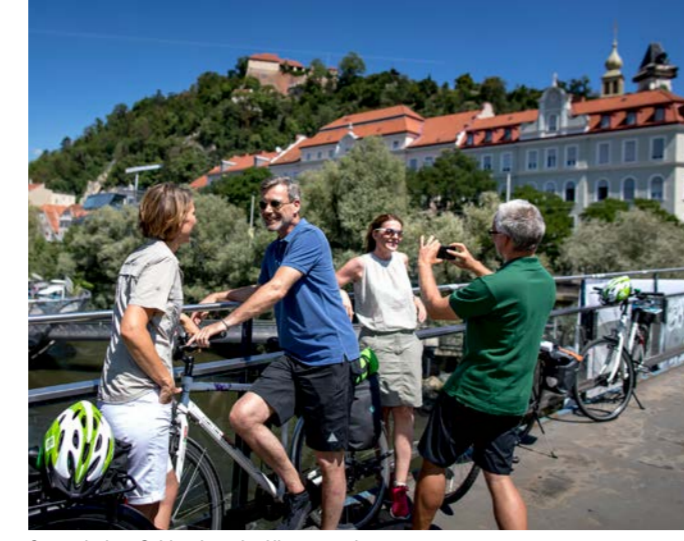
Graz mit dem Schlossberg im Hintergrund

MURRADWEG. DER WOHL LANDSCHAFTLICH ABWECHSLUNGSREICHSTE RADWEG IM ALPENRAUM. ER FÜHRT ZU ZAHLREICHEN KULINARISCHEN MANUFAKTUREN UND INSPIRIERT DURCH ALPINE LANDSCHAFTEN WIE AUCH WEINGÄRTEN UND AUWÄLDER IM SÜDEN.