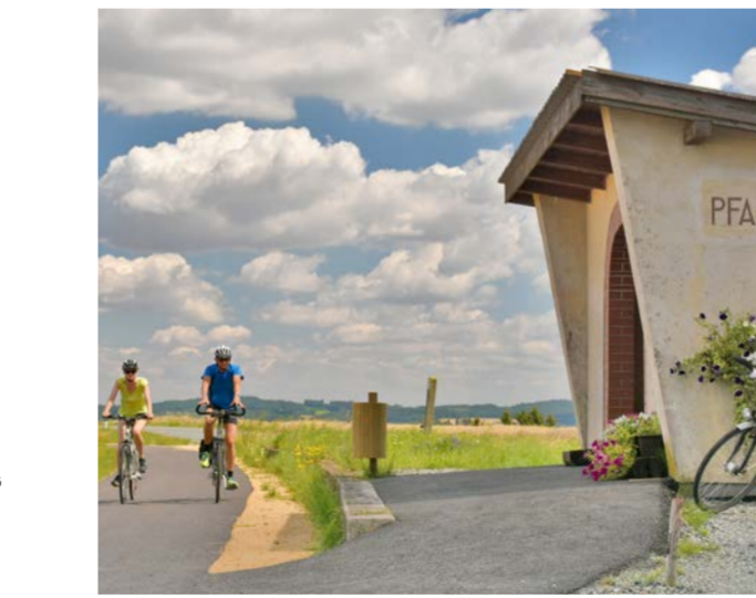
Unterwegs in Pfaffenslag

THAYARUNDE. „GENUSSRADELN“ LAUTET DIE DEVISE IM RADPARADIES THAYALAND IM NÖRDLICHEN WALDVIERTEL. RADELN AUF EHEMALIGEN BAHNTRASSEN IST BESONDERS BEI FAMILIEN BELIEBT.