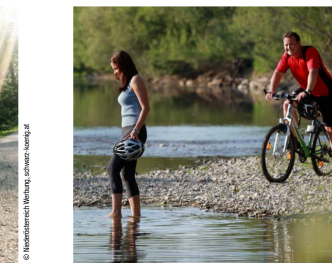
Abkühlung am Traisental-Radweg

TRAISENAL-RADWEG. ENTLANG DER STRECKE BEZAUBERN ABWECHSLUNGSREICHE LANDSCHAFTEN: VON MILD BIS WILD, VON SANFTEN HÜGELN SÜDLICH DER DONAU BIS HINAUF IN DIE IMPOSANTE BERGWELT DER MOSTVIERTLER ALPEN.