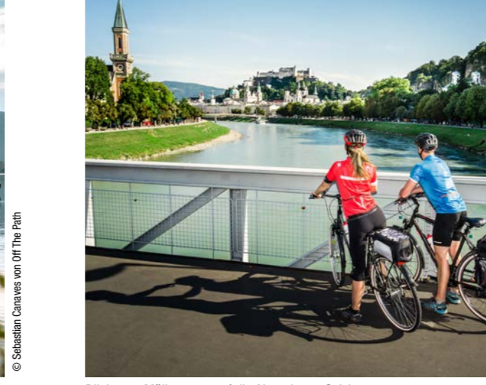
Blick vom Müllnersteg auf die Altstadt von Salzburg

TAUERNRADWEG. GROSSES BERGKINO ENTLANG SPEKTAKULÄRER HÖHEPUNKTE WIE DEN KRIMMLER WASSERFÄLLEN, DEM NATIONALPARK-ZENTRUM HOHE TAUERN IN MITTERSILL ODER DER MOZARTSTADT SALZBURG.