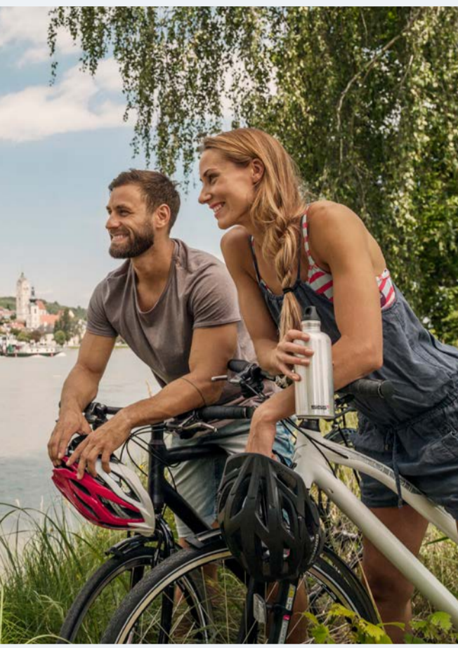
Donauradweg mit Blick auf Krems

Auf den schönsten Radouren in Österreich nimmt man nicht nur die Naturpracht des Landes in eigenen Rhythmus auf, sondern taucht auch in eine besondere europäische Geschichte ein. Die seit jeher von der Lage im Herzen Europas geprägt ist. Die zum Teil auch grenzüberschreitenden Touren entlang von Flüssen, Weinrändern und Seenlandschaften sowie vorbei an imposanten Gipfeln und Bergkuppen bieten eine landschaftliche Vielfalt, die in Europa ihresgleichen sucht.