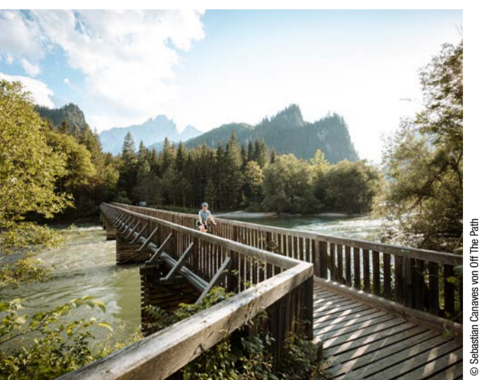
Unterwegs im Nationalpark Gesäuse

ENNSRADWEG. IMPOSANTE BERGE WIE DER DACHSTEIN, RAUSCHENDE WILDBÄCHE UND HISTORISCHE STÄDTE WIE RADSTADT, SCHLADMING ODER STEYR SIND WEGBEGLEITER AM ENNSRADWEG, DER DURCH DIE NATIONALPARKE GESÄUSE UND KALKALPEN FÜHRT.