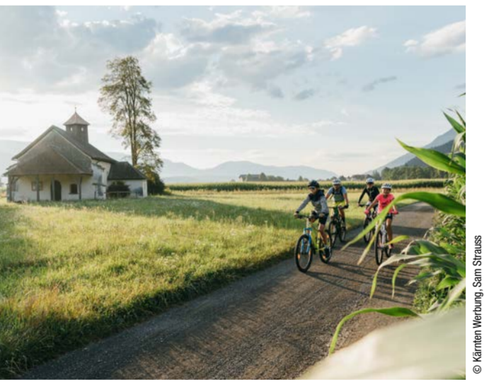
Unterwegs bei Spittal an der Drau

ALPE ADRIA RADWEG. IN EINER WOCHE AUF BESTEHENDEN RADWEGEN VON SALZBURG DURCH DEN NATIONALPARK HOHE TAUERN IN DEN SÜDEN NACH KÄRNTEN UND ÜBER DIE GRENZE ÖSTERREICHS NACH ITALIEN BIS AN DIE ADRIA.