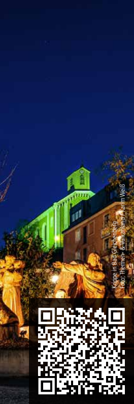
Klippe in Bad Gleichenberg